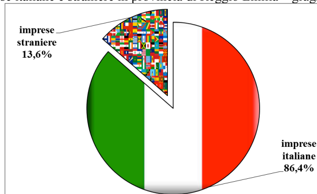
Imprese italiane e straniere in provincia di Reggio Emilia – giugno 2015