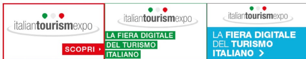
ITE Italian Tourism Expo