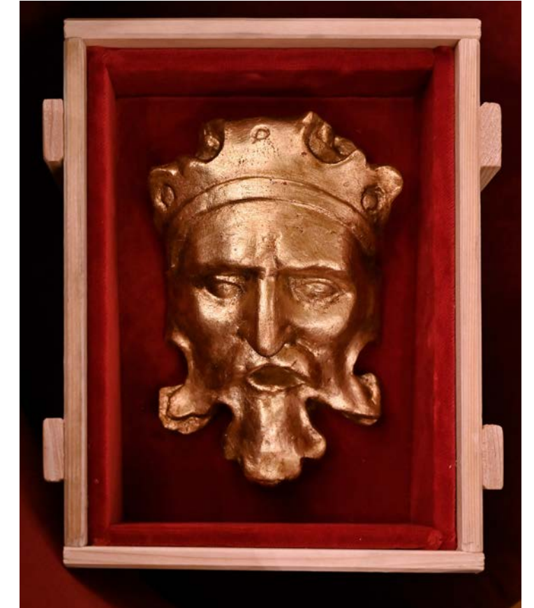
Mascherone 13x18x5 cm € 90,00

Un pezzo di Teatro Regio a casa tua con la riproduzione in polvere di marmo di una delle teste di Telamone che decorano i palchi del Teatro Regio, parte degli ornamenti in stucco disegnati da Girolamo Magnani - storico scenografo di Giuseppe Verdi - nel 1853. Il mascherone, realizzato nei laboratori di scenografia e decoarato a foglia oro, è confezionato in una preziosa scatola di legno rivestita di velluto rosso.