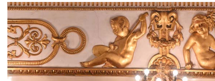
Putto 20x25x3,5 cm € 95,00