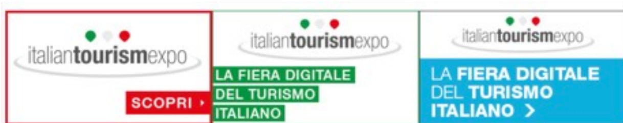
ITE Italian Tourism Expo