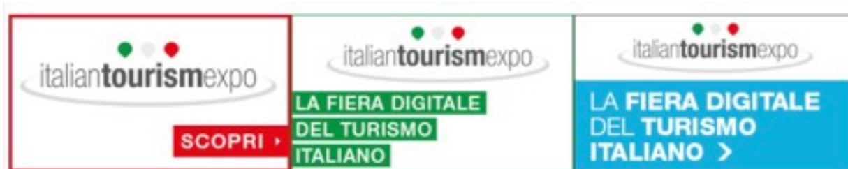
ITE Italian Tourism Expo