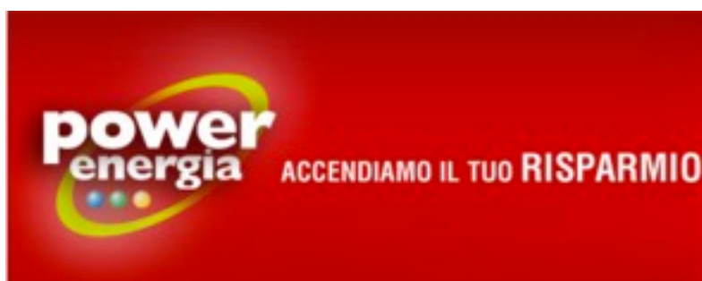
Power Energia Società Cooperativa