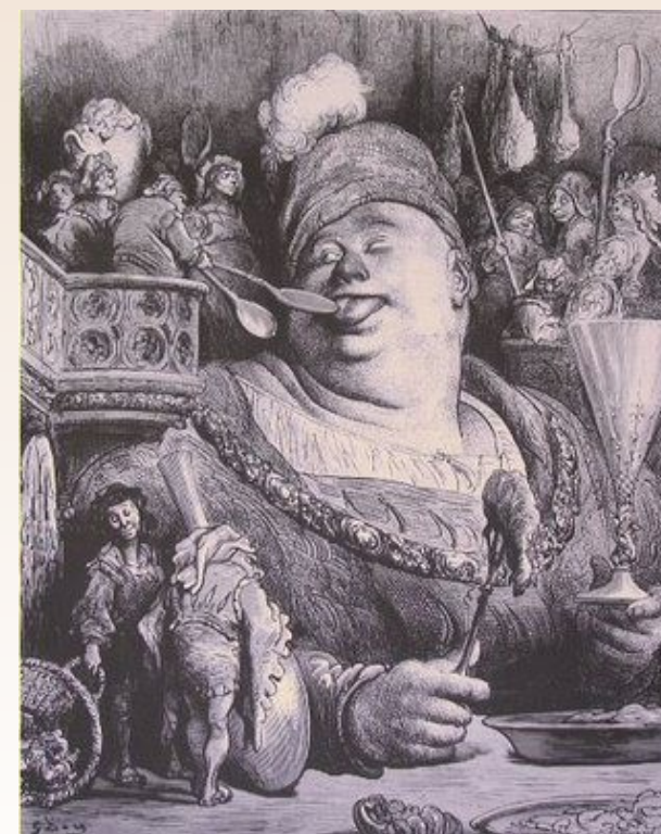
Gustave - Paul Dorè, Pantagruel

PARMA 27 SETTEMBRE 2014 AULA CONGRESSI AZIENDA OSPEDALIERO— UNIVERSITARIA DI PARMA