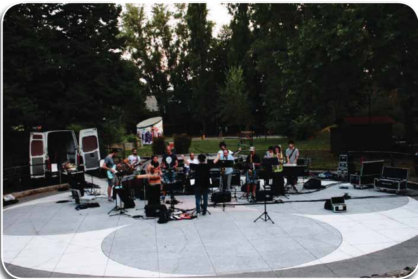
Novi di Modena, prove dello spettacolo Pop Story del 9 luglio 2013, per la rassegna l'eMilia e una... Note