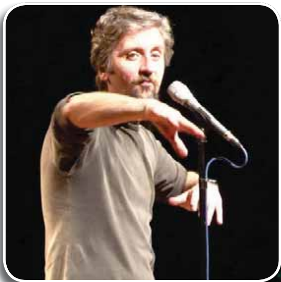
Finale Emilia, Teatro Tenda, 31 gennaio 2014: Ascanio Celestini nello spettacolo Il piccolo paese