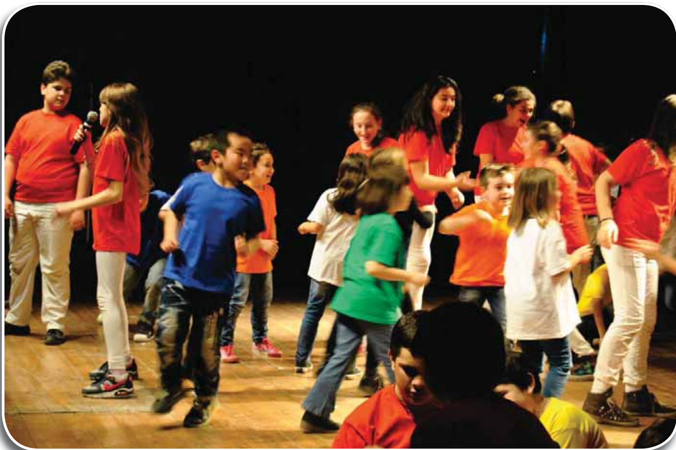
Finale Emilia, Teatro Tenda 23 febbraio 2014: i bambini di San Felice Sul Panaro nel saggio del laboratorio corri Pinocchio