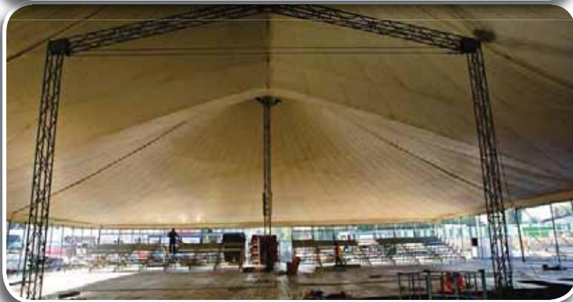
Mirandola 2012: l'allestimento degli interni del Teatro 29