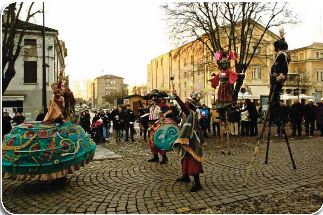
Mirandola, 5 gennaio 2013: Fiesta, parata spettacolo a cura del Teatro Due Mondi