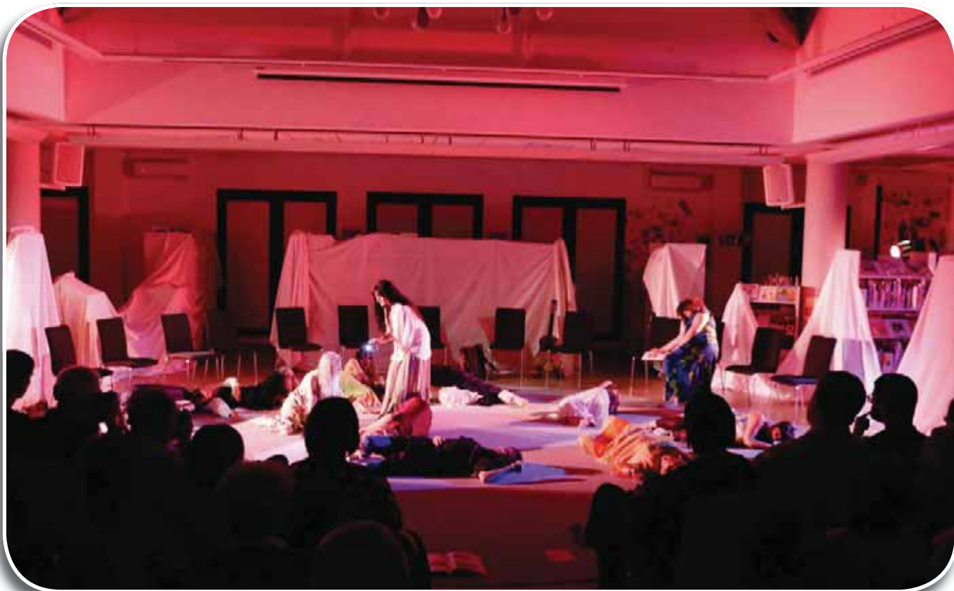
Cavezzo, 16 maggio 2014: prova aperta del laboratorio Danzare il tempo