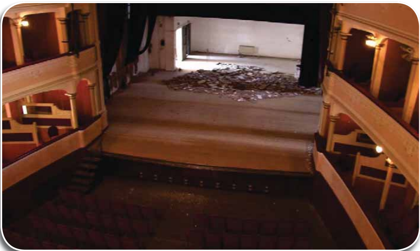
San Felice sul Panaro, il Teatro Comunale