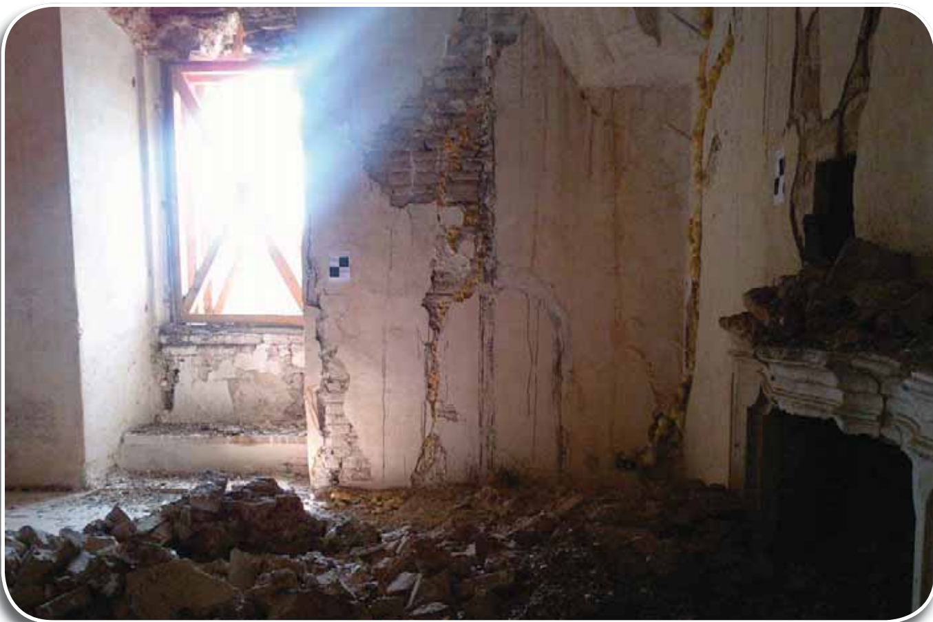
Interno della Rocca Estense di San Felice sul Panaro