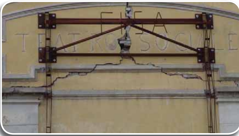
Finale Emilia, particolare del Teatro Sociale