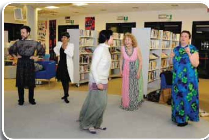
Cavezzo: una prova del laboratorio Danzare il tempo