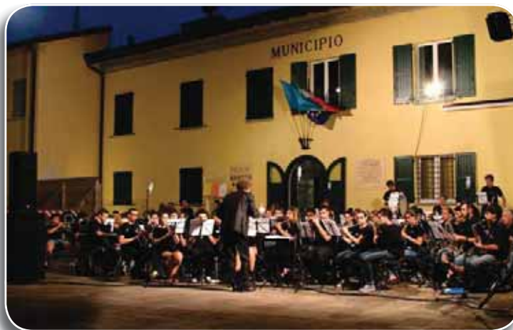
San Possidonio, 12 luglio 2013: la banda giovanile John Lennon si esibisce nello spettacolo La forza dei destini, nell'ambito della rassegna l'eMilia e una... Note