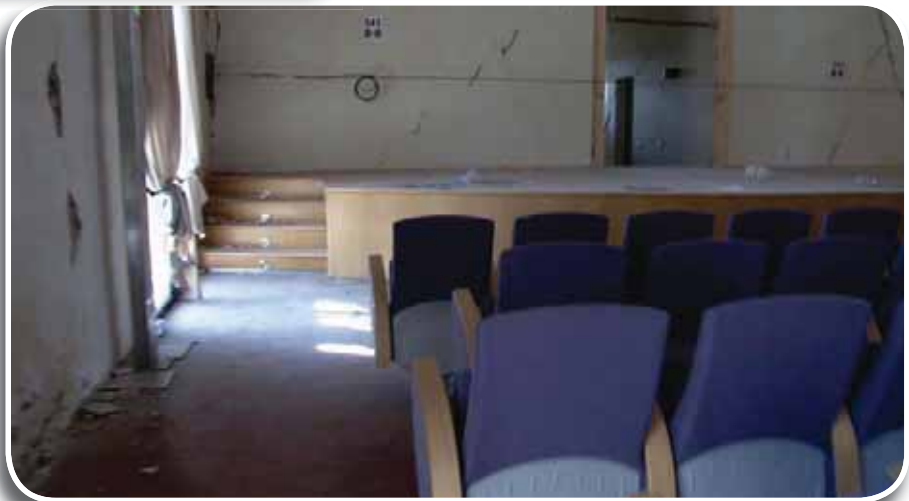
Mirandola, l'Auditorium del Castello dei Pico