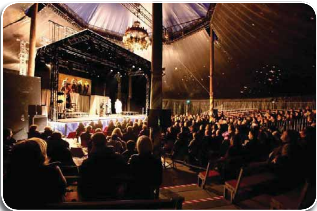
Cento, spettacolo al PalaBorgatti