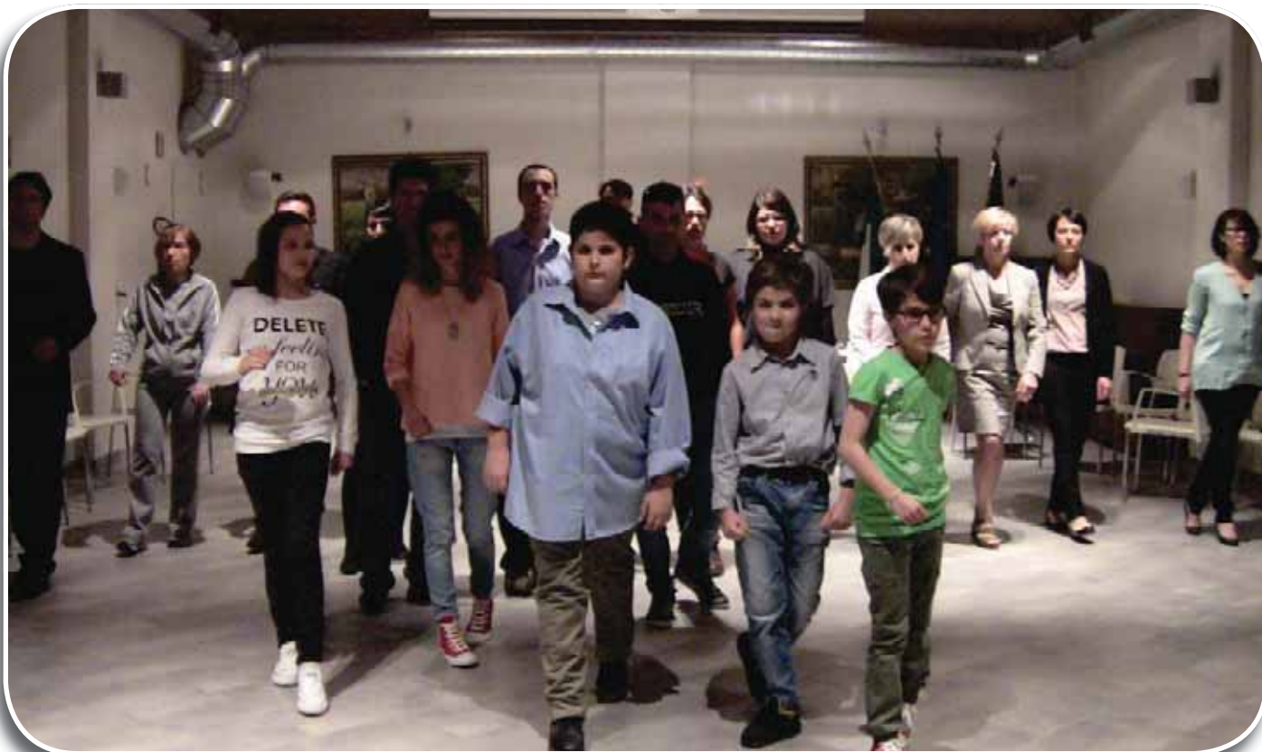
Novi di Modena, 2014: una prova del laboratorio L'Emilia sulla luna/Secondo passo