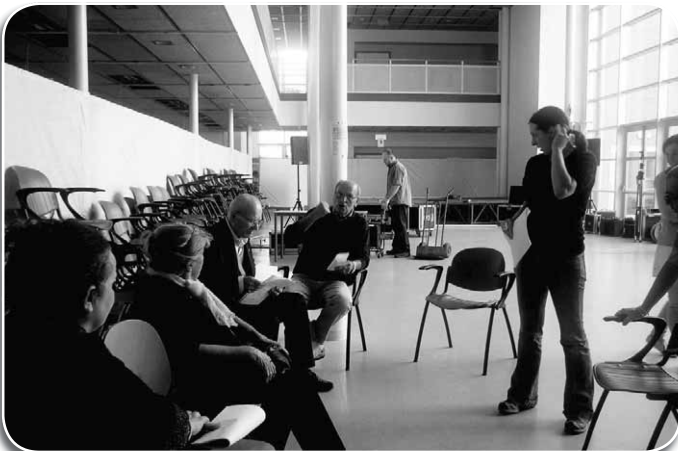
Mirandola, il laboratorio Parliamo un po' – doni di parole