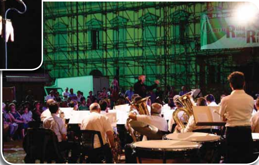
Concordia sulla Secchia, 17 luglio 2013: spettacolo in piazza in occasione del bicentenario della nascita di Giuseppe Verdi, nel corso della rassegna LeMilia e una... Note