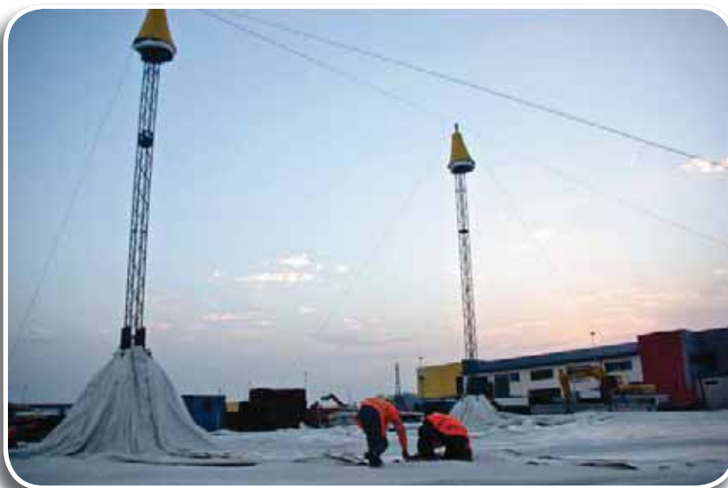
Mirandola 2012: l'allestimento della tensostruttura che diventerà il Teatro 29