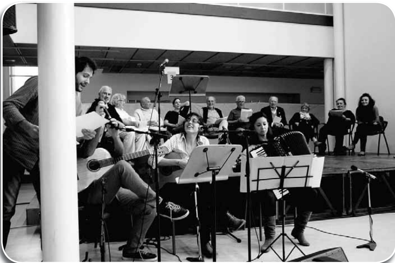
Mirandola, 13 ottobre 2012, le prove del saggio di Parliamo un po' – doni di parole