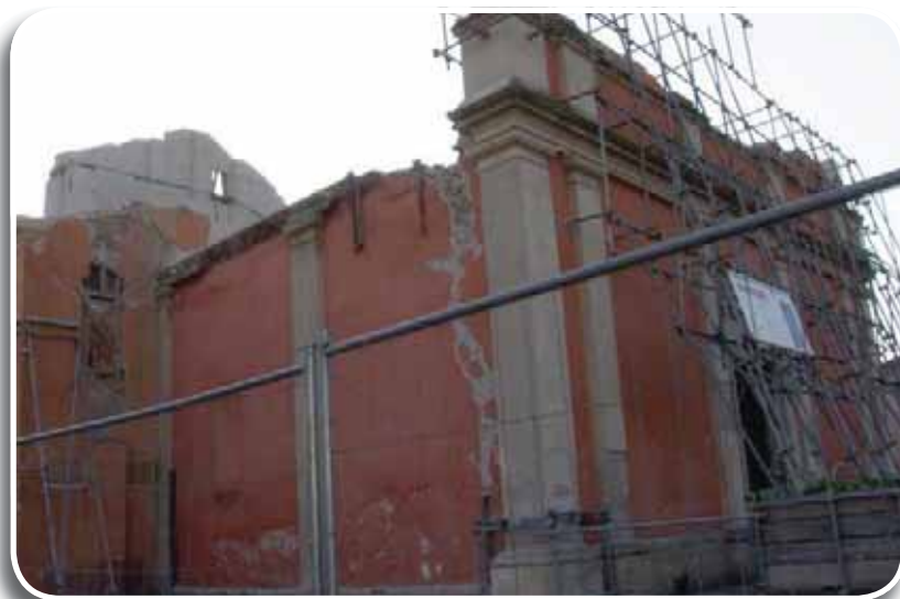
La chiesa di Cavezzo

Assessore Cultura, Scuola, Asilo nido, Politiche giovanili del Comune di Cavezzo