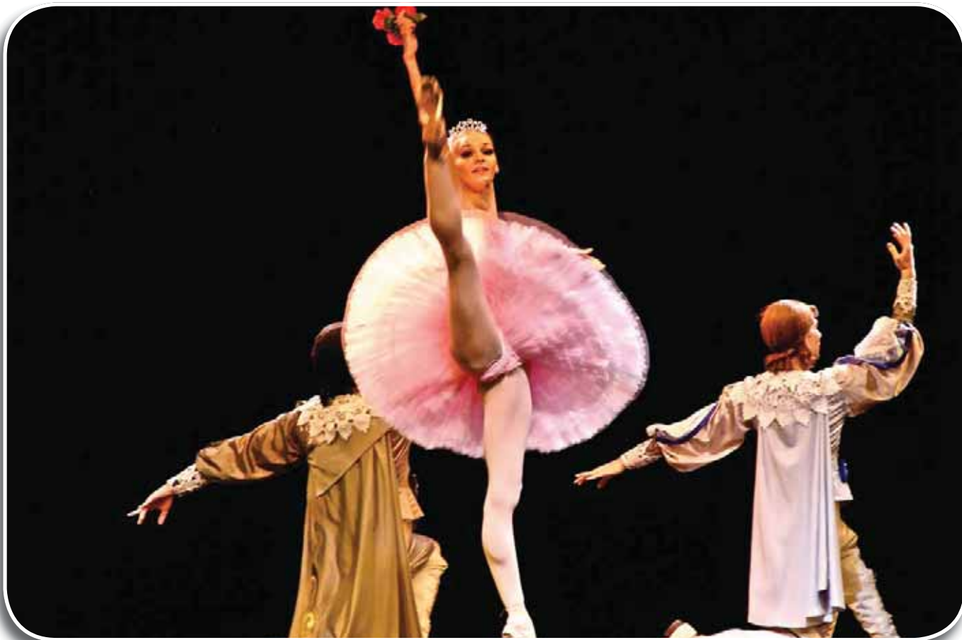
Mirandola, Teatro 29, 11 dicembre 2012: Primi ballerini dell'Opera di Kiev, Suite dalla Bella addormentata