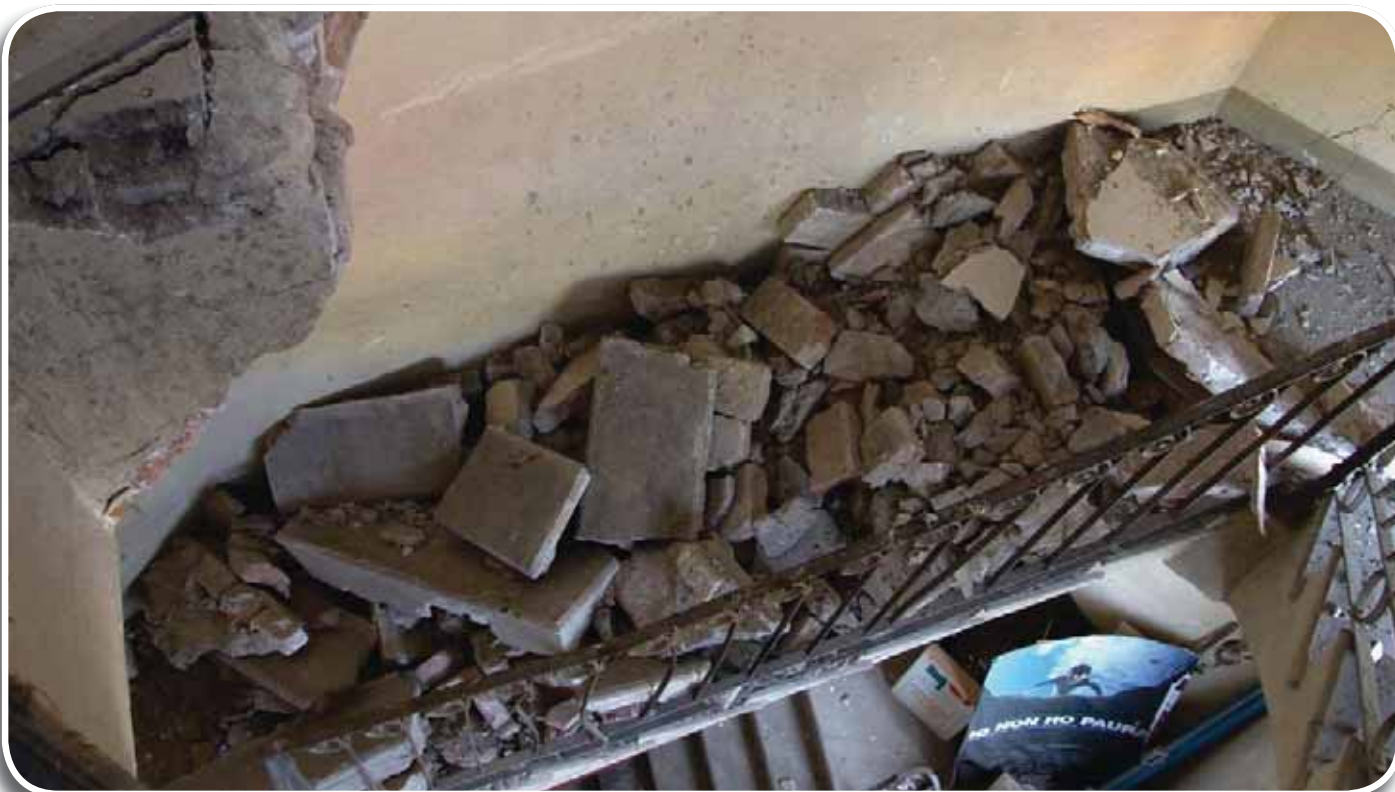
Particolare della scalinata liberty del Teatro Comunale di San Felice sul Panaro, crollata con la scossa del 29 maggio 2012