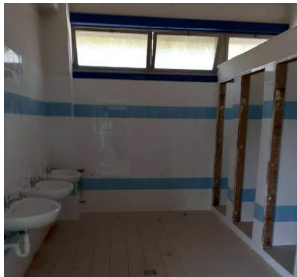
Istituto "Russell" Rifacimento servizi igienici