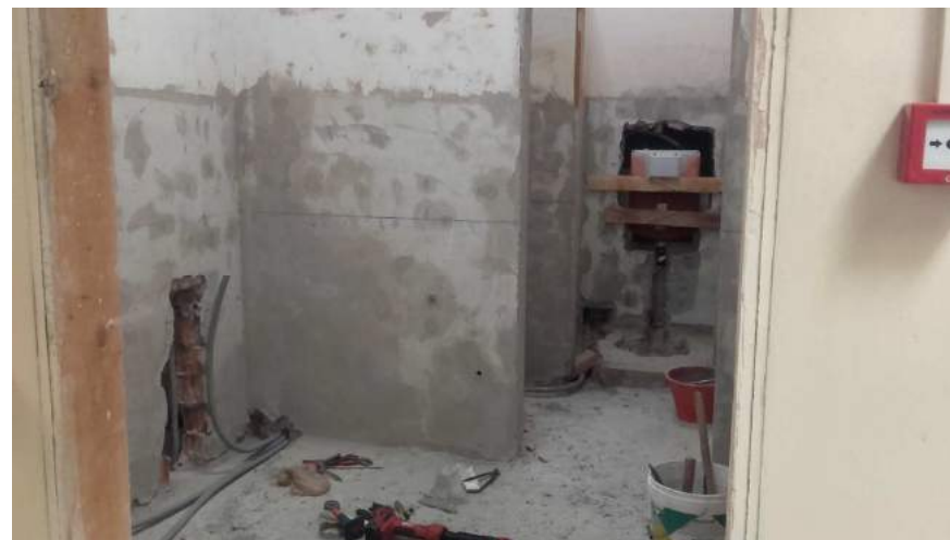
Istituto "Gobetti" Rifacimento servizi igienici