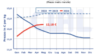
Italia, Parma - Parmigiano Reggiano stag. minimo 24 mesi e oltre (qualità scelta 12% fra 0-1, per lotti di partita) Fonte: CCGIA Parma (Prezzo medio mercato)

-Parmigiano Reggiano 15 mesi di stagionatura e oltre: 10,95 – 11,20 €/Kg. (+) - -Parmigiano Reggiano 18 mesi di stagionatura e oltre: 11,45 – 11,95 €/Kg. (+) - -11,55– 11,75 €/kg (=) -Parmigiano Reggiano 24 mesi di stagionatura e oltre: 12,10 – 12,35 €/Kg. (+) - -12,20 – 12,70 €/kg (=) -Parmigiano Reggiano 30 mesi di stagionatura e oltre: 12,40 –12,95 €/Kg. (+) - -12,75 – 13,30 €/kg (=)